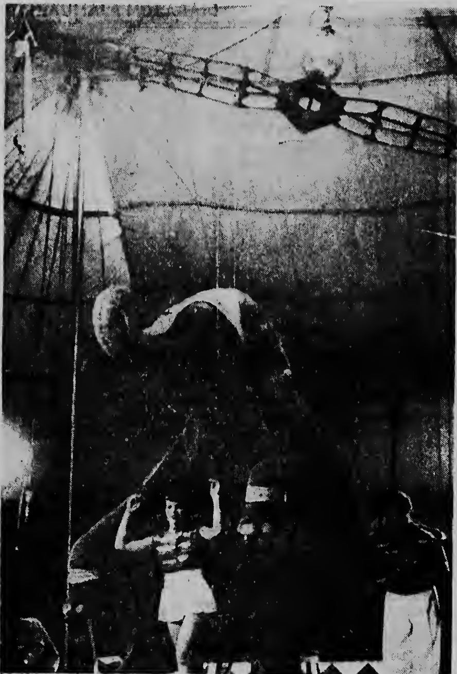
ROYAL DUMBAR dunando presentacion na Oranjestad. Dilanto di Jumbo: Nubia.